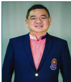
นายประชา อัครนิเวศน์ ประธาน กต.ตร.