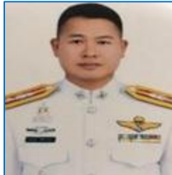
พ.ต.ท.ธเนศ ศรีจำปา รอง พกก.สส.สน.นางเลิ้ง