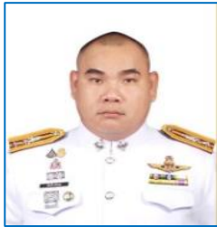
พ.ต.ท.อธิบดี เสริมสุข รอง พกก.ป.สน.นางเลิ้ง