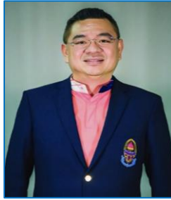
นายประชา อัครนิเวศน์ ประธาน กต.ตร.