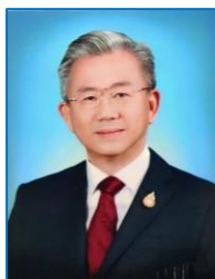
นายเล็ก พรหมกามณี รองประธาน กต.ตร.